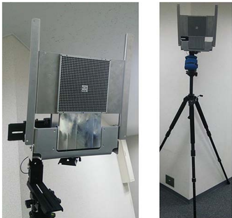
図3. 60GHz帯ワイヤレス GATE システム

60GHz帯の高速性、空間分離性といった特性を最大限に活かすために、例えば駅の改札ゲートのように、隣接して複数の装置が設置されていても、無線区間で混信することなく、それぞれ独立した装置として動作するようなシステム(以下GATEシステム)を実現しました。ここでは、東工大(安藤・広川研究室)で開発された、空間分離を可能にする高利得スロットアレイアンテナ(構築試験では1000素子程度)により、アンテナの前方10m以上に渡り、電波が拡散しない筒状のサービスエリアを実現しました。また、このエリアをユーザが短時間で通過するシナリオを想定し、通信可能になるまでのリンクセットアップ時間を2ms以下まで低減可能な無線通信制御システムを、(1)において開発したRF/BB LSI上にソニーが実装しました。これら技術を日本無線がGATEシステムとして統合しました。また、Content Centric Networking (CCN) [用語6] という次世代のネットワークアーキテクチャ技術を用いて、KDDI研究所が開発 ※3 した、ヘテロジニアスネットワークにおける大ゾーン long-term evolution (LTE)とミリ波小ゾーン(60GHz帯)とを協調動作させる方式を本システムに採用することにより、GATEシステムを通過時にユーザが意識することなくミリ波帯で高速ファイル転送を利用することができます。