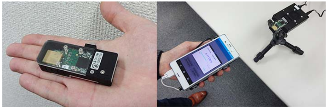
図2. 60GHz帯無線モジュール(左)とスマートフォンへの6.1 Gbps無線ファイル転送実験の様子(右)

において最大物理層速度6.57Gbpsという、60GHz帯として高い帯域利用効率を装置として実現いたしました。なお、この無線モジュールは、現在規格化中のIEEE802.15.3e [用語5] の1stドラフトをベースに設計されています。また、端末技術では大容量キャッシュメモリへの高速データアクセスを可能にしたファイル転送システムを開発し、無線モジュールと端末を含めた無線システム全体で6.1 Gbpsという(1Gバイトのファイルを約1.3秒で送れる)世界最高のユーザデータ伝送速度の無線ファイル転送に成功しました。本技術により、モバイル端末の処理速度を上回る高速で、かつ一瞬で大容量ファイルを受け取る事ができます。