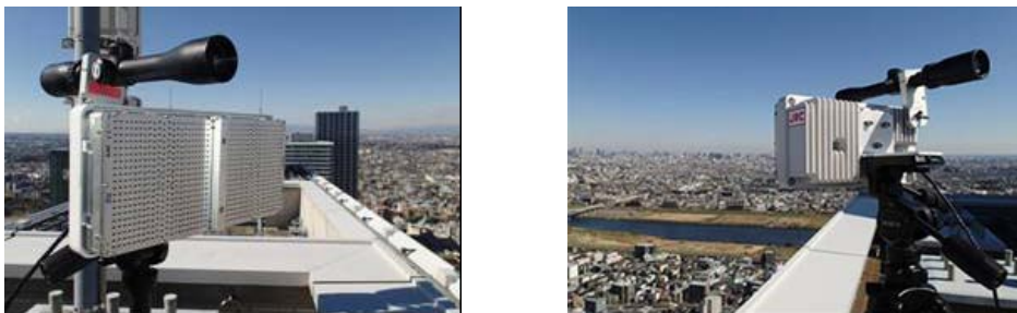
図4. 40GHz帯DDD方式 無線通信装置

小型でポータブルなアクセスポイントである60GHz帯ワイヤレス GATE システムを迅速にかつ自在に配置しサービスエリアを構築するには、これをネットワークに収容するための、やはり設置の自由度が高いワイヤレスリンクが有利です。組み合わせの一例として通信速度1Gbpsで伝送距離1km以上の40GHz帯無線伝送システムと、60GHz帯GATEシステムを協調動作させる構成も実フィールドで実証しました。40GHz帯の無線通信方式は同一周波数・同一偏波で同時双方向通信を実現することにより、従来のFrequency Division Duplex(FDD)方式やTime Division Duplex(TDD)方式と比較して原理的に2倍の周波数利用効率を実現しています。本方式の実現のため「高アイソレーション送受信アンテナ並列配置技術」と「自局送信波回り込みキャンセル技術」を世界で初めて調和的に動作させています。