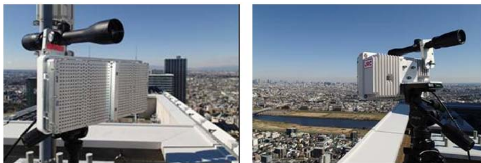
図4. 40GHz帯DDD方式 無線通信装置

小型でポータブルなアクセスポイントである60GHz帯ワイヤレス GATE システムを迅速にかつ自在に配置しサービスエリアを構築するには、これをネットワークに収容するための、やはり設置の自由度が高いワイヤレスリンクが有利です。組み合わせの一例として通信速度1Gbpsで伝送距離1km以上の40GHz帯無線伝送システムと、60GHz帯GATEシステムを協調動作させる構成も実フィールドで実証しました。40GHz帯の無線通信方式は同一周波数・同一偏波で同時双方向通信を実現することにより、従来のFrequency Division Duplex (FDD) 方式やTime Division Duplex (TDD) 方式と比較して原理的に2倍の周波数利用効率を実現しています。本方式の実現のため「高アイソレーション送受信アンテナ並列配置技術」と「自局送信波回り込みキャンセル技術」を世界で初めて調和的に動作させています。