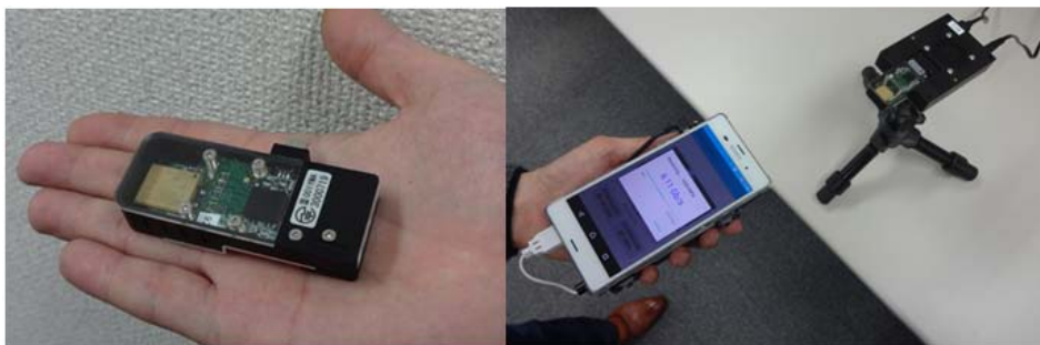
図2. 60 GHz帯無線モジュール（左）とスマートフォンへの6.1 Gbps無線ファイル転送実験の様子（右）

東工大とソニーは2012年に、60 GHz 無線 LSI の共同開発を行い、6.3 Gbps の物理層速度をCMOS LSIとして達成しました [2]。今回、東工大において利得 6 dBi のスラブ導波路アンテナ(安藤・広川研究室)、ダイレクトコンバージョン方式の65 nm CMOS 60 GHz RF LSI と 2.3 G Sample/s 7-bit analog-to-digital converter (ADC) 等のアナログ回路 (松澤・岡田研究室)、及びソニーにおいて上記アナログ回路とrate-14/15 及び 11/15 の新規Rate-compatible LDPC符号*4を用いた物理層と無線制御 (MAC) 層を含む 40 nm CMOS Baseband LSIを搭載した無線モジュールを開発し、帯域幅2.16GHzにおいて最大物理層速度6.57Gbpsという、60 GHz 帯として高い帯域利用効率を装置として実現いたしました。なお、この無線モジュールは、現在規格化中のIEEE802.15.3e*5 の1stドラフトをベースに設計されています。また、端末技術では大容量キャッシュメモリへの高速データアクセスを可能にしたファイル転送システムを開発し、無線モジュールと端末を含めた無線システム全体で6.1 Gbpsという（1Gバイトのファイルを約1.3秒で送れる）世界最高のユーザデータ伝送速度の無線ファイル転送に成功しました。本技術により、モバイル端末の処理速度を上回る高速で、かつ一瞬で大容量ファイルを受け取る事ができます。