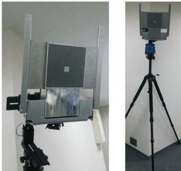
図3. 60 GHz帯ワイヤレス GATE システム

セットアップ時間を2ms以下まで低減可能な無線通信制御システムを、(1)において開発したRF/BB LSI上にソニーが実装しました。これら技術を日本無線がGATEシステムとして統合しました。また、Content Centric Networking (CCN) *6という次世代のネットワークアーキテクチャ技術を用いて、KDDI研究所が開発[3]した、ヘテロジニアスネットワークにおける大ゾーン long-term evolution (LTE) とミリ波小ゾーン (60GHz帯) とを協調動作させる方式を本システムに採用することにより、GATEシステムを通過時にユーザが意識することなくミリ波帯で高速ファイル転送を利用することができます。