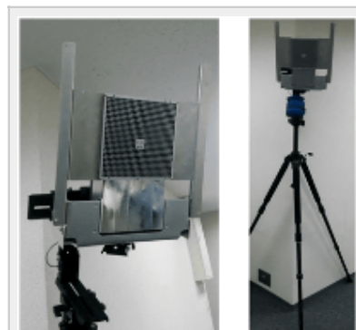
60GHz帯 n 装置

端末～装置間の60GHz帯通信では、アンテナの前方10m以上にわたって電波が拡散しない、筒状のサービスエリアを作り上げた。このエリアをユーザーが通るときだけ60GHz帯で超高速通信を行う。さらに、現在規格が策定中という「IEEE802.15.3e」をベースにした無線モジュールを新たに開発。2.16GHz幅という広い帯域幅の電波を用いて、通信速度が6.1Gbps、1GBのファイルを約1.3秒で送れる速度を実現した。