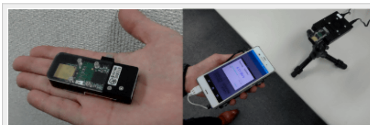
新規開発のモジュール

3月2日～4日に開催される移動通信ワークショップ（会場：東京工業大学大岡山キャンパス）で公開実験が行われる予定。