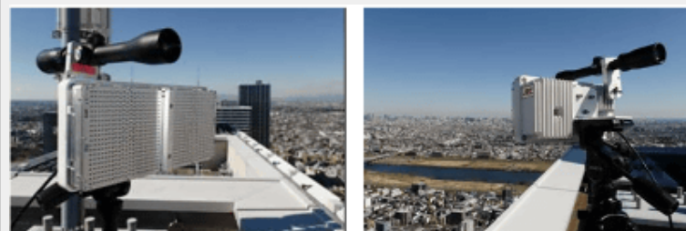
40MHz帯を使う中継装置

今回は、ユーザーの手にする端末と、その近くにある装置の間は60GHz帯で繋ぎ、装置から先の1kmほどの距離は40GHz帯で繋ぐ形としておいた。たとえばゲリラ豪雨とも呼ばれるような夏の夕立に見舞われると、40GHz帯の通信は途切れてしまうことがある。そこで雨が降る予報の場合は、あらかじめ40GHz帯ではなく、雨の影響を受けない別の経路に迂回する、という手法を採用することにした。