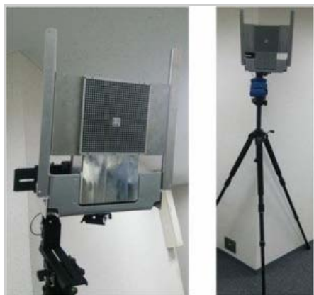
60GHz帯通信におけるGATEシステム。混信を起こすことなく複数の通信を可能とする

大容量データに対応するミリ波帯（30GHz以上）の電波を用いるデータ転送ネットワークの共同開発で、ソニーと東工大では60MHz帯ワイヤレス通信を試作。専用LSIと高速ファイル転送技術により、モバイルサイズの通信モジュールに対して6.1 Gbpsのファイル転送できることを確認した。